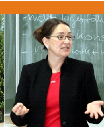
Führen Leiten Managen